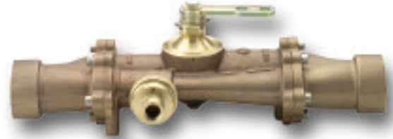
Venturi-Zumischer mit Umleitung

3126 Zumischer für Fahrzeugeinbau, 475 l/min (125 Gallon/min)